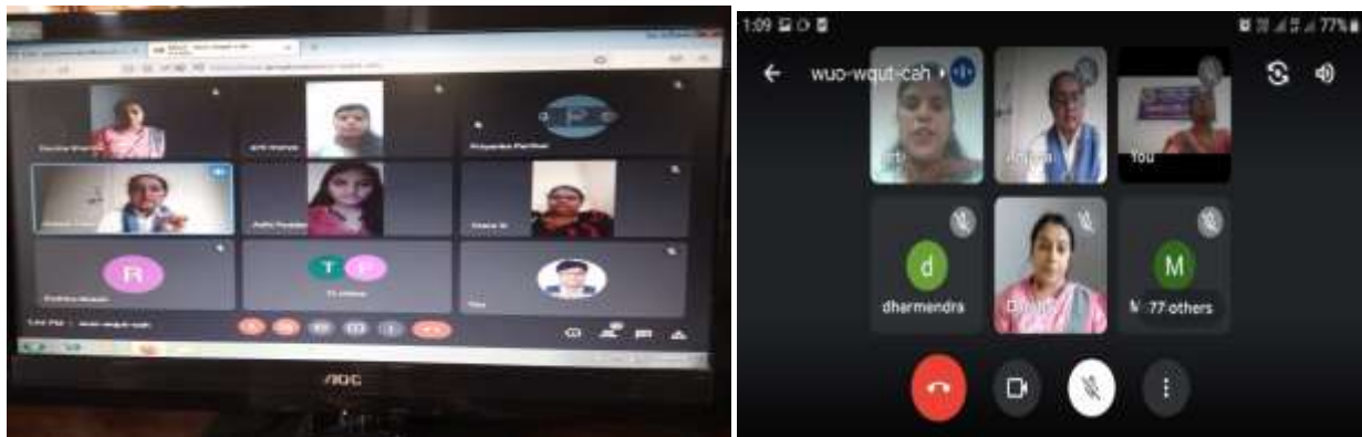
WEBINAR (2020 -21)